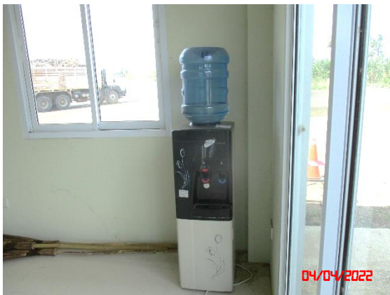
น้ำดื่มสำหรับพนักงาน