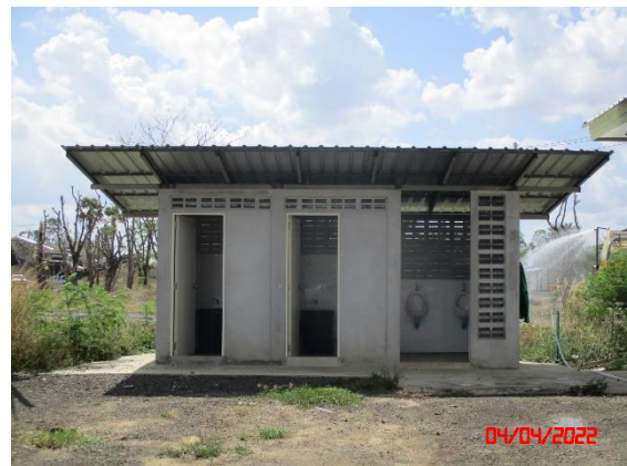
ห้องสุขา