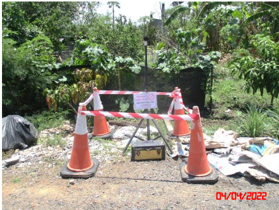
ชุมชนบ้านห้วยลึก