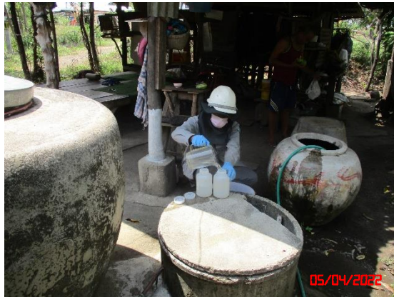
บ่อน้ำบาดาลชุมชนบ้านห้วยลึก