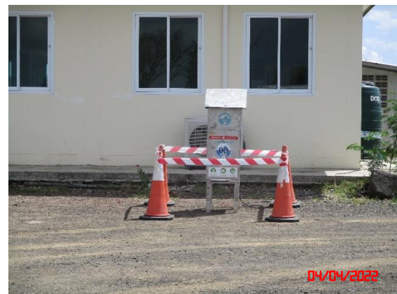
สำนักงานโรงโม่หินของโครงการ