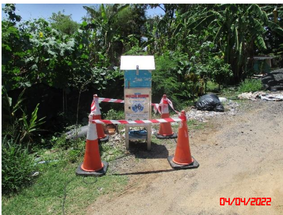
ชุมชนบ้านห้วยลึก