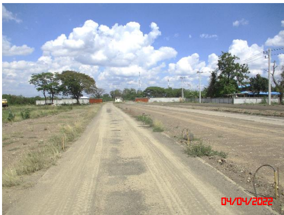
ถนนบดอัดแน่นบริเวณโรงโม่หิน