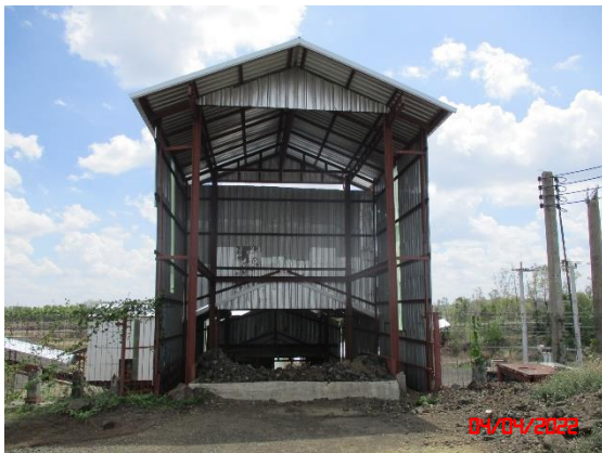
อาคารปิดคลุมยังรับหินใหญ่