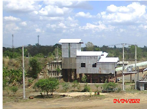
แนวต้นไม้บริเวณโรงโม่หิน