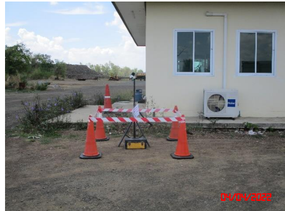
สำนักงานโรงโม่หินของโครงการ