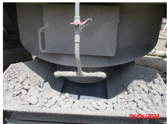
ระบบสเปรย์น้ำบริเวณกำเนิดฝุ่นละออง