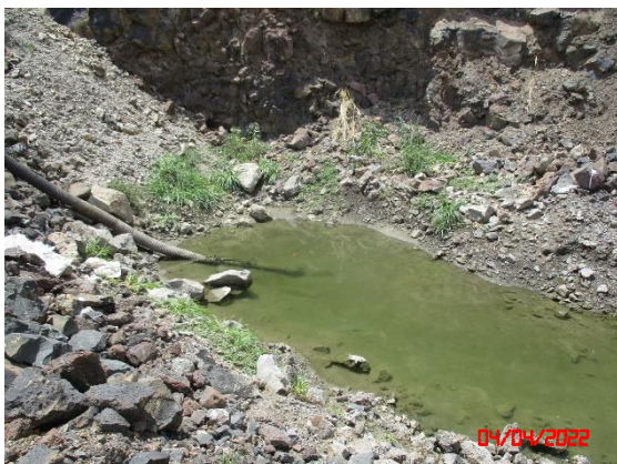
รูปที่ 2-22 บ่อรับน้ำ (Sump) ชุมเหมือง