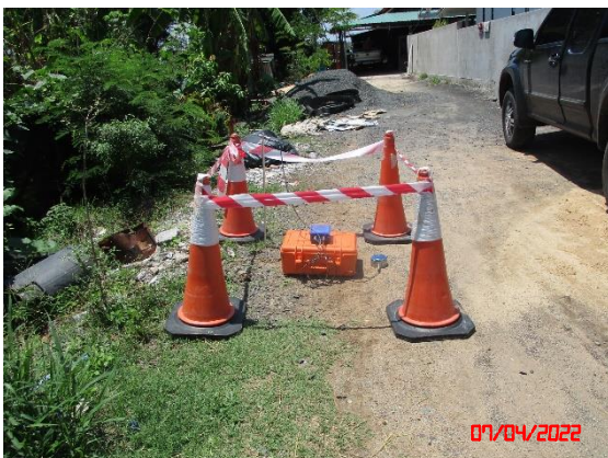
ชุมชนบ้านห้วยลึก