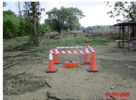
สำนักงานโรงโม่หินของโครงการ