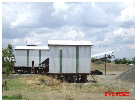
อาคารปิดคลุมโรงโม่หิน