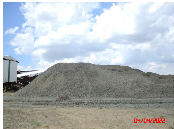
ลานกองแร่ที่เป็นลานหินบดอัดแน่น