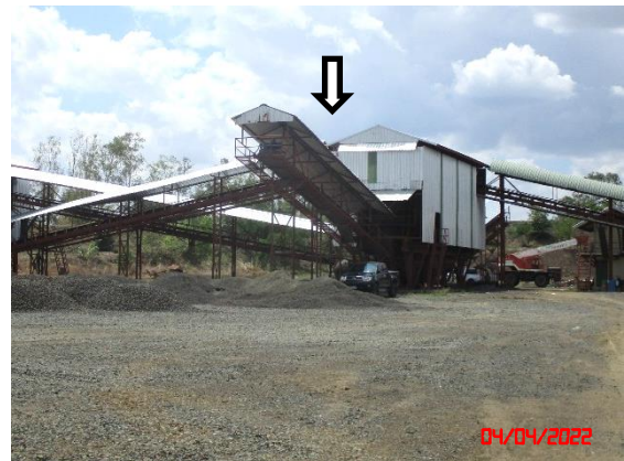
หลังคาปิดคลุมสายพานลำเลียง